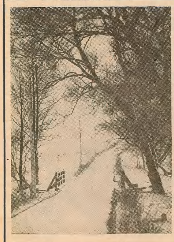
ВЯЗЫНКА. ЗІМА НА РАДЗІМЕ ПАЭТА.